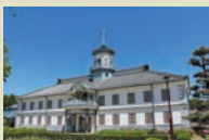
▲国宝旧開智学校校舎