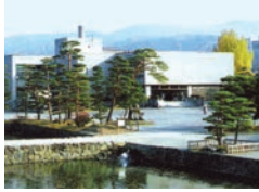
▲現松本市立博物館