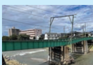
▲上高地線 田川鉄橋