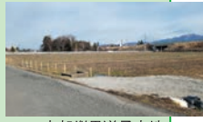
▲中部縦貫道予定地