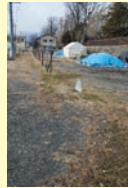
▲松本城南・西外堀現状