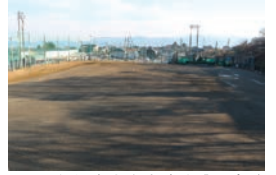
▲新松本市立病院建設予定地